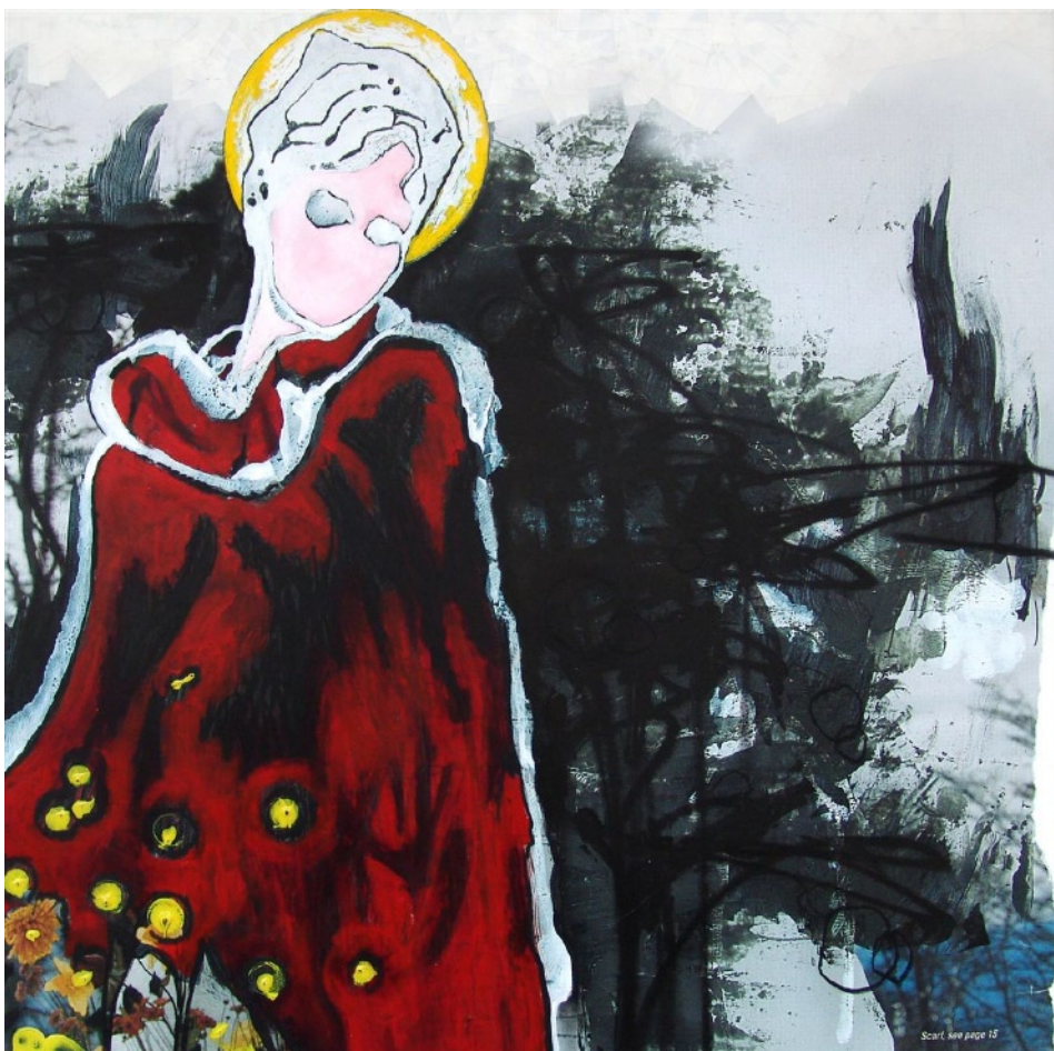
Jack Warren , Untitled , 2006, technique mixte sur toile, 114 x 114 cm