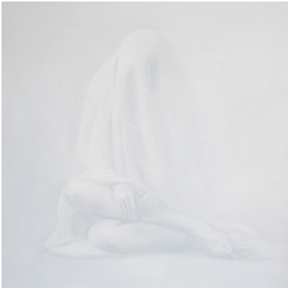
Zan Jbai , Long time, 2007, huile sur toile, 150 x 150 cm